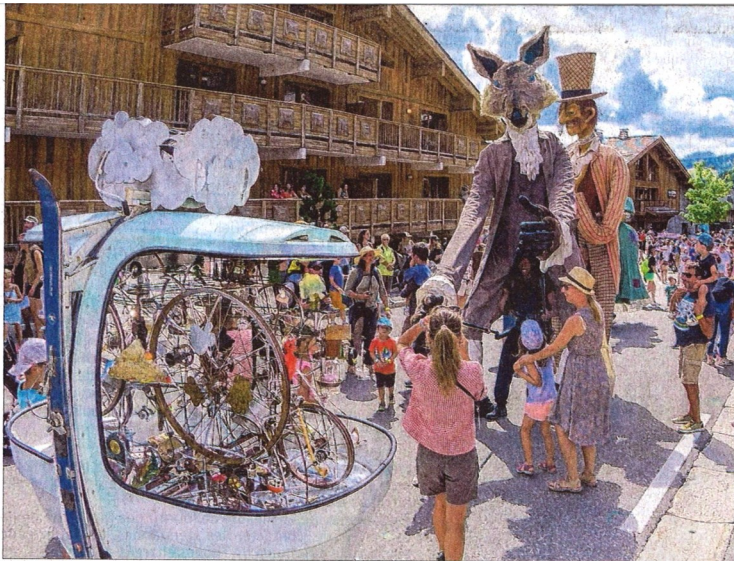
La rafraîchissante boule de neige du théâtre de la Toupine est l'un des neuf manèges présenté cette année par la cie éviannaise. Ils seront présents toute la semaine sur la place Nomade.