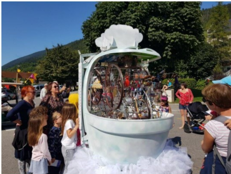
La boule de neige spéciale "réchauffement climatique" .