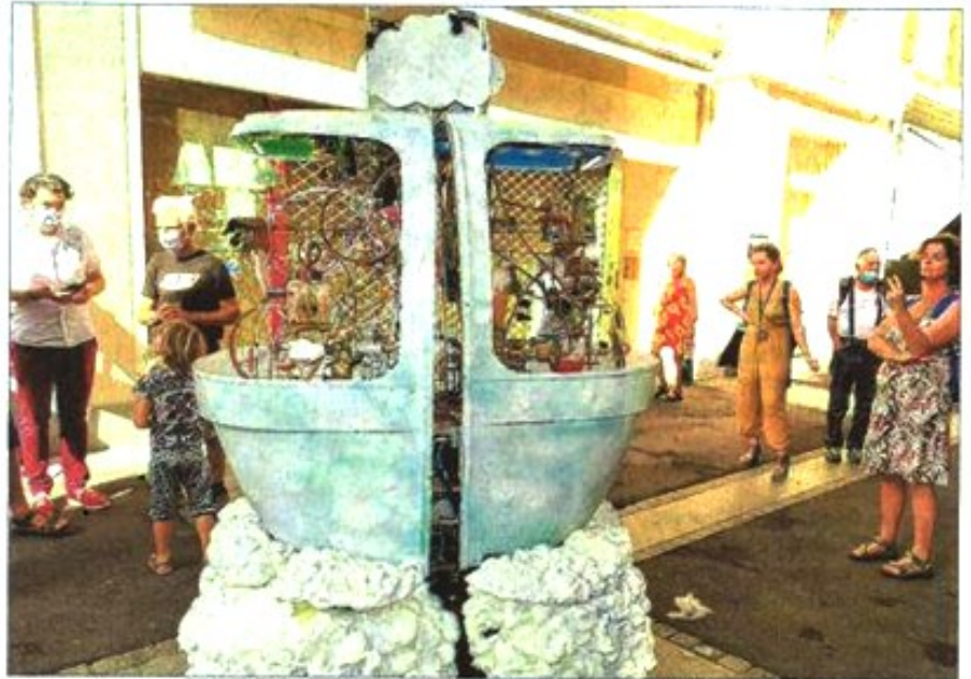
Cet “œuf” commandé à distance et plein de saynètes à messages a attiré un nombreux public dans la rue Nationale.