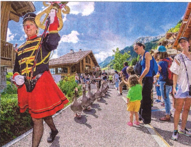
Troupe historique du Bonheur des Mômes, la Ganzenfanfare (fanfare d'oies) néerlandaise est adorée des petits festivaliers. On pourra la voir déambuler toute cette semaine.