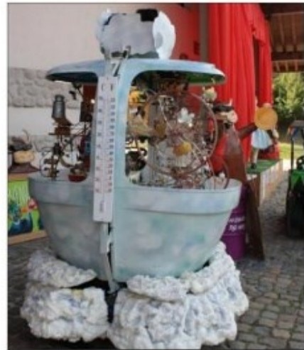
Une œuvre à la fois cinétique et ludique au pays du Bonheur des Mômes.