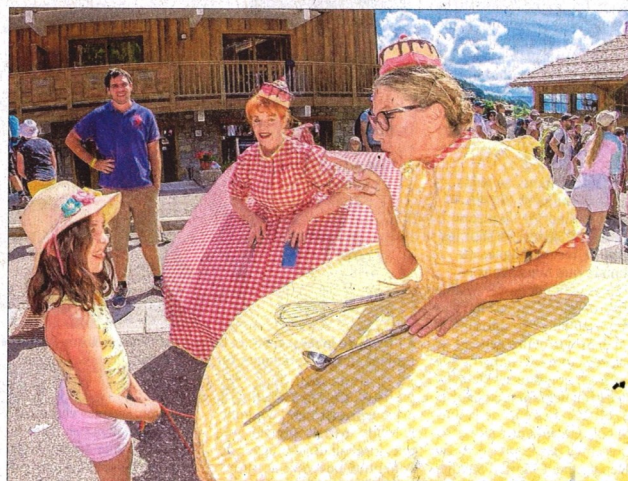
La cie de l'Une à l'autre (Évian-les-Bains) a déambulé avec son spectacle À Table ! . On pourra voir les deux comédiennes toute la semaine dans Ni prince, ni princesse ! à la Boule, le nouveau lieu du festival.

➤ Chapiteau Coup de Pouce. 9 h 30 et 11 h, Caddie à Caddie , cie Sonel. 15 h 30 et 17 h 30, SAKINIPLI origami , cie Milétoiles. ➤ Maison du patrimoine. Cie Le Conte Vers : 10 h et 11 h, La magie des fleurs . 17 h 30, Visite guidée et contée . 20 h 30, Veillée contée . ➤ La grange aux étoiles-la Source. Cie Teia Moner : 10 h et 11 h 30, Puces Cirkus Moner . 15 h 30 et 17 h, Magarium . ➤ Chapitoto. 9 h 45, Hors contrôle , cie Absolu Théâtre. 12 h, Le cirque des étoiles , cie Comme une Étincelle. 13 h 30, Cornelius et les déchets , cie Cornelius et cie. 16 h, les Frères Bellini , cie Absolu Théâtre. 18 h, Manolo ou la recherche du bonheur , cie Antoine Guillaume.