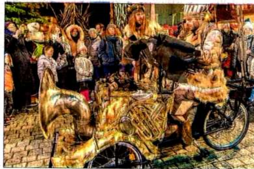
Le pianiste avec son drôle de piano roulant

Dans le cadre du Fabuleux Village, un concours de photos est organisé. Chaque jour, une photo est retenue par un jury formé au sein du Théâtre de la Toupine. Au terme des trois semaines de l'événement et fort d'un éventail de 21 "photo flottines du jour", le jury sacrera la photo flottine de cette 16 e édition. Pour participer, adresser par mail sa ou ses photo(s) à fabuleuxvillage@theatre-toupine.org . Il fallait bien un binôme pour partager ce très joli cliché qui immortalise le nouveau Flottin-pianiste qui a intégré cette année, la tribu des Flottins-musiciens avec son piano roulant. Ses prestations musicales ont été particulièrement appréciées des visiteurs et il semble même avoir réussi à impressionner le Flottin, joueur de didjeridoo en arrière-plan.