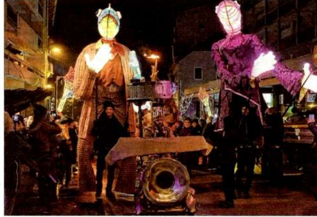
La déambulation du cortège dans la rue Nationale avec, en ouverture, le Flottin-musicien, suivi des deux monstres lacustres précédant le chariot du père Noël.