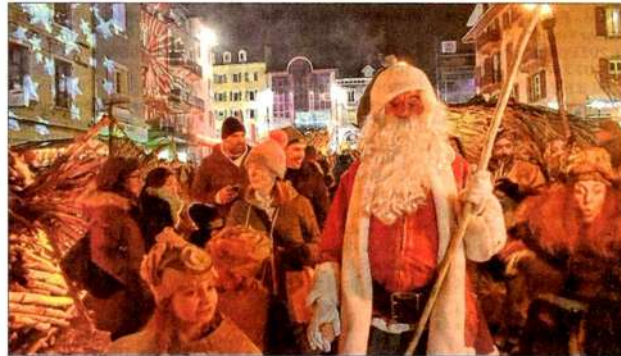
Le père Noël a salué la foule venue à sa rencontre, avant de déambuler dans le Fabuleux village.