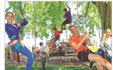
Une activité très prisée pendant les deux jours : la grimpe d'arbres encadrée par des moniteurs.