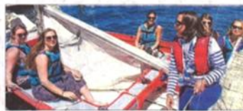
Le club de voile propose une initiation tout le jour.