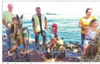
La Toupine est présente avec ses tout nouveaux "manèges théâtre écologiques individuels à propulsion parentale" pour les enfants de 2 à 8 ans (gratuit).