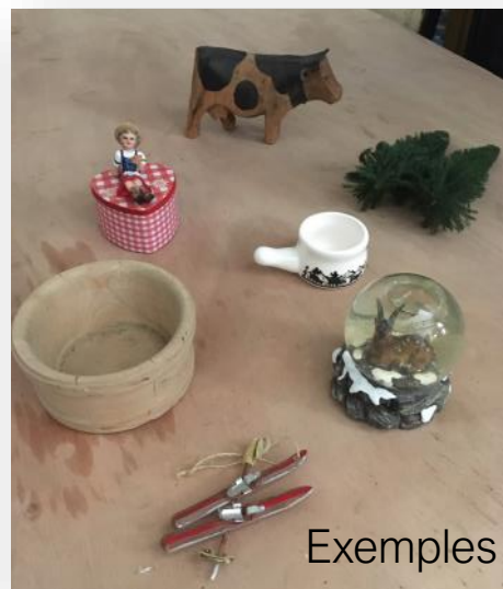
Exemples de sujets

La cabine sera équipée d'une machine à neige et d'une machine à brouillard téléguidée à distance.